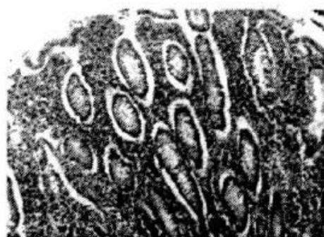
慢性结肠炎治疗前肠黏膜HE染色(x200)